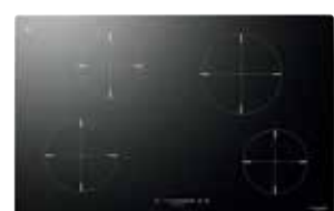
שחור CH 804 ID TS BK