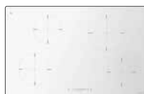
לבן CH 804 ID TS WH